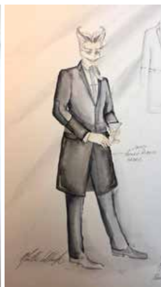
Kostýmní návrhy Mattie Ullrich k inscenaci opery R.U.R z roku 2015.